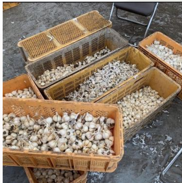
2020年 ニンニクの収穫