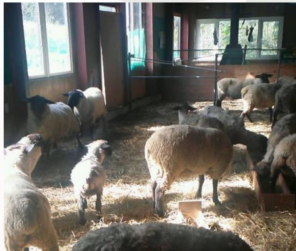
2016年 羊牧場の柵作り