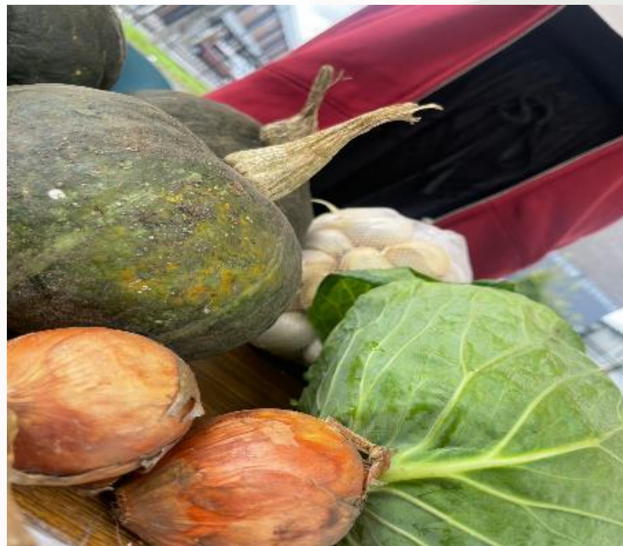
2023年 紅葉祭での出店