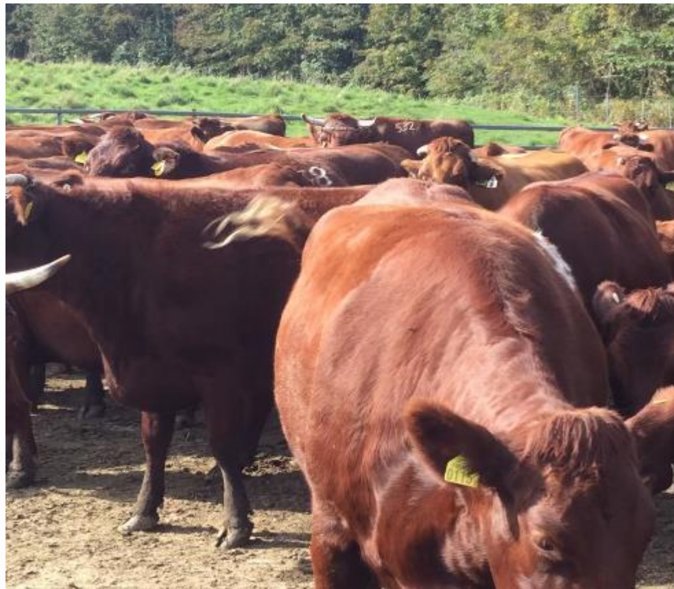
2017年 学内家畜の扱い方講習会